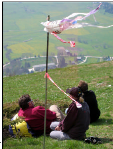
En attendant que ça soit moins fort...

Le site sera fermé le week-end du 21 août (ball-trap). Consulter impérativement l'affichage avant de voler. Ci-dessous, un mémo pour l'atterrissage. Respecter les cultures, élevages, et clôtures!